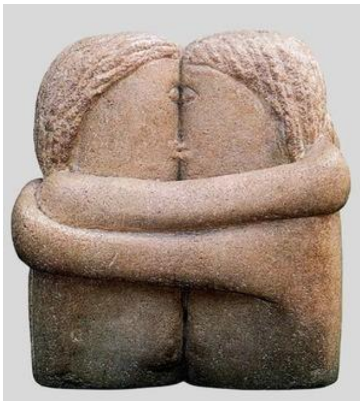
Constantin Brancusi, „Pocăunek”, Philadelphia Museum of Art, Philadelphia, PA, USA [ http://www.philamuseum.org/collections/permanent/51306.html?mulR=322621882|9 ]

1. Przypomnijcie sobie wasze konkluzje interpretacyjne dotyczące znaczeń motywu pocałunku ujawnionych w omawianych wierszach. Jakich sensów nabiera pocałunek w tych utworach, w których fragmentach odnajdujecie te sensy?